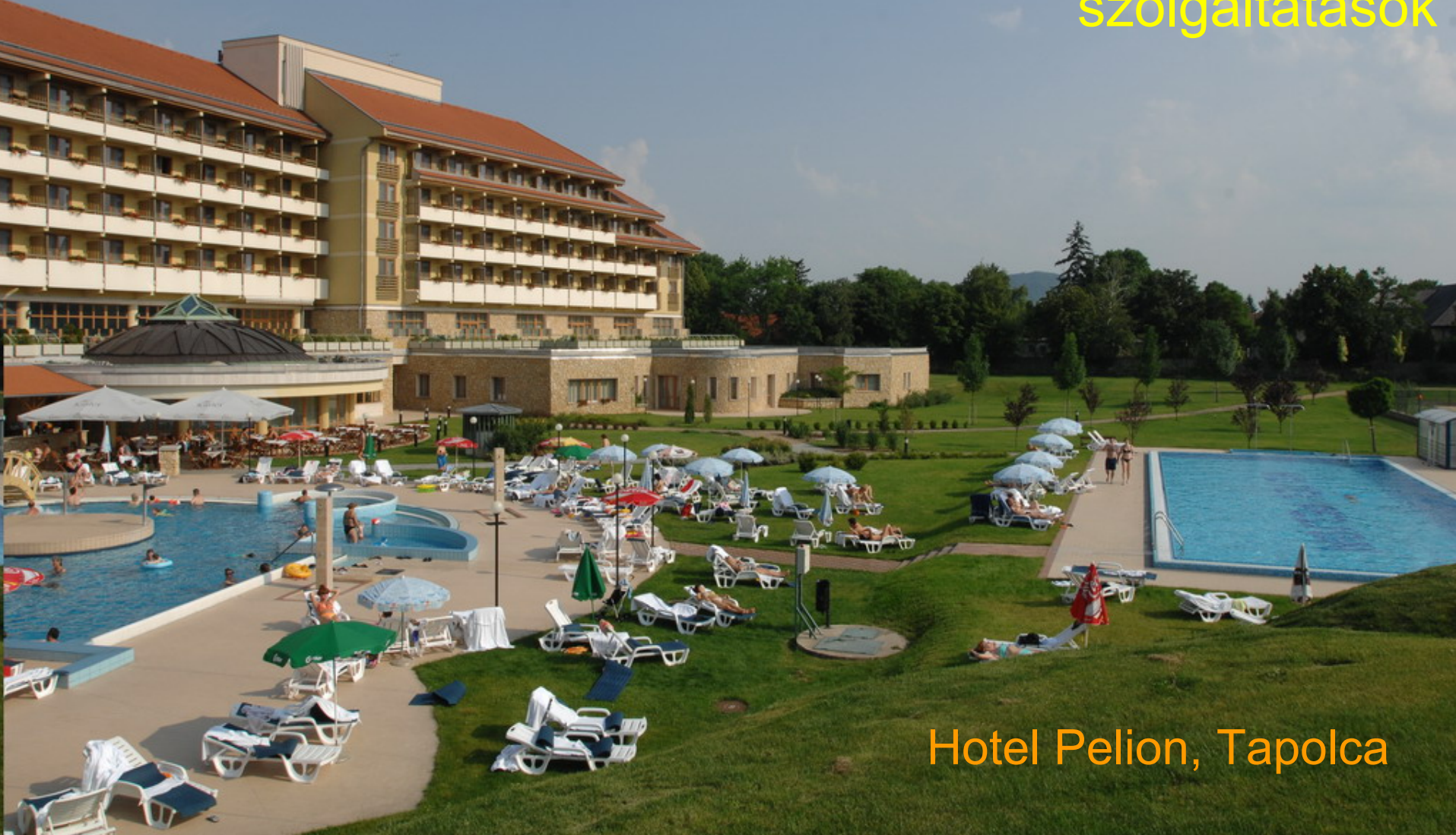
Hotel Pelion, Tapolca

Fürdőinkben és szállodáinkban biztosított programok, szolgáltatások