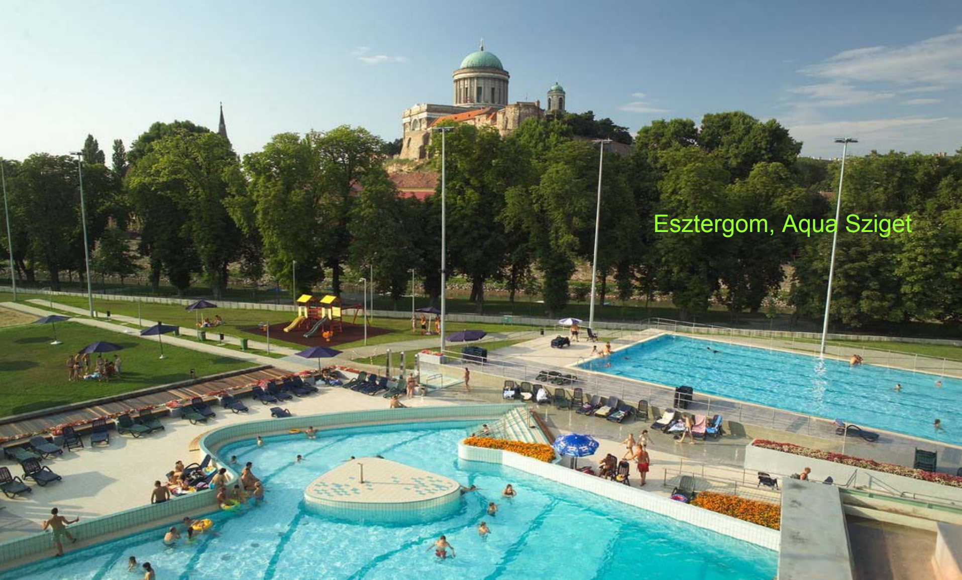
Esztergom, Aqua Sziget